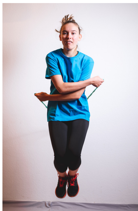
Geht noch mehr?